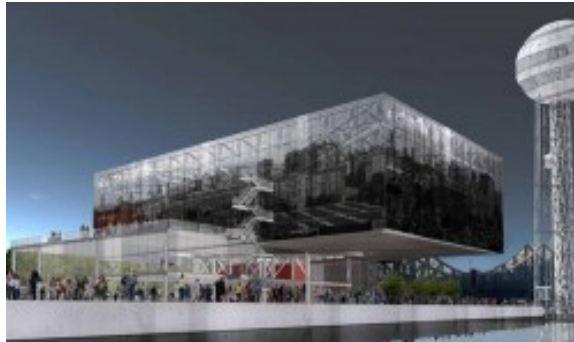
Port Rimbaud, le pavillon 7 , Jakob architecte

Pour le pavillon 8, au sud du Port Rimbaud, L'agence Odile Decq & Benoît Cornette a proposé un bâtiment qui « réinterprète l'architecture industrielle » et s'intègre au paysage urbain grâce au travail, sur la façade, de l'artiste Felice Varini.